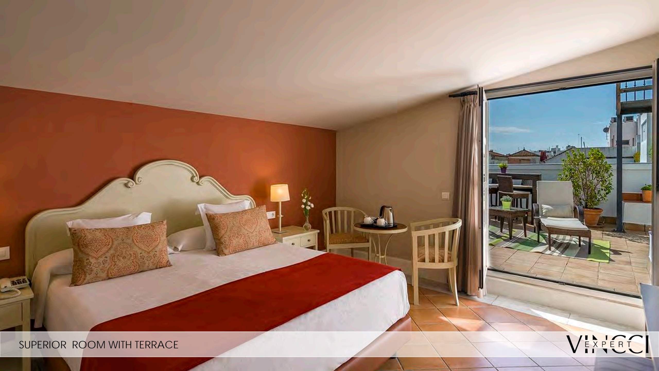
SUPERIOR ROOM WITH TERRACE