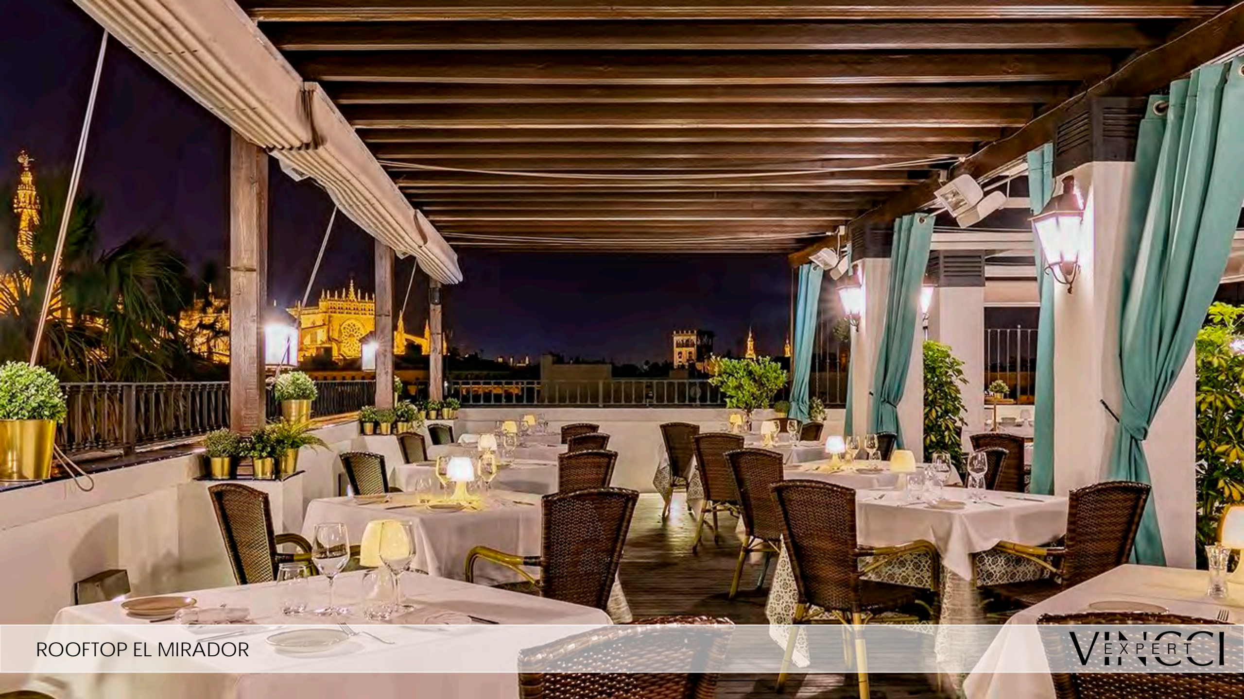
ROOFTOP EL MIRADOR